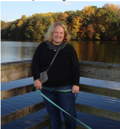
Herbst in Greensboro, North Carolina

Auslandserfahrung – diese Anforderung lässt sich heutzutage in wirklich vielen Stellenanzeigen für Absolventen wieder finden. Ich wusste bereits mit Beginn meines Studiums, dass ein Auslandssemester für mich nicht in Frage kommt. Wenn man sich darüber hinaus auch nicht zu einem Au Pair-Job berufen fühlt, dann bleibt einem fast nichts anderes übrig als sich auf die Suche nach einem Praktikumsplatz zu begeben.