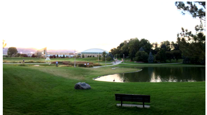
Campus der Colorado State University mit den Rocky Mountains im Hintergrund

Der Campus umfasst alle Fakultäten und bietet eine große Bandbreite an Sportmöglichkeiten. Der tägliche Sprung in den Pool wurde zum Ritual auf dem abendlichen Heimweg. So fiel der Abschied Anfang Oktober sehr schwer.