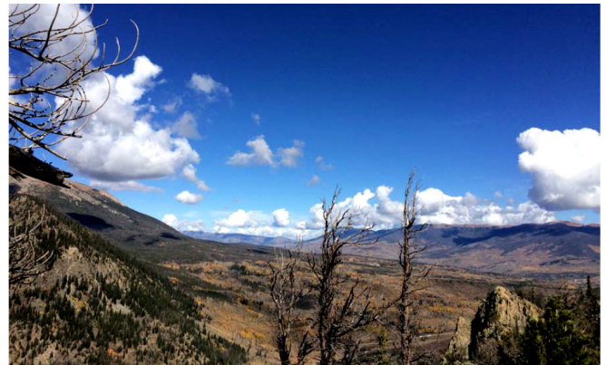
Blick vom Mt. Royal

Die geographische Lage macht es sehr reizvoll an den Wochenenden im Rocky Mountain Nationalpark wandern zu gehen. Die Hochgebirgslandschaft bietet anspruchsvolle Wandermöglichkeiten und eine beeindruckende Vielfalt von Flora und Fauna. Die Umgebung ist übersät mit Seen die zum Kanufahren einladen.