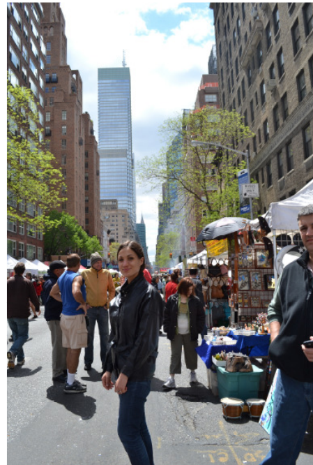
Eines der vielen Straßenfeste am Wochenende

Auch wenn man den Eindruck gewinnen kann, dass New Yorker meistens in Eile sind, machte ich auch gegenteilige Erfahrungen. So fragte ich einmal eine junge Frau auf der Strasse in Manhattan, ob sie einen guten Buchladen in der Nähe kenne. Sie war sehr aufgeschlossen und bot mir an mich in den Buchladen zu begleiten. Dort versuchte sie für mich ein Buch zu finden, das meinen Vorstellungen entsprach und gab mir persönliche Buchtipps. Die Erfahrung, dass man durch praktisch-orientierte Fragen leicht ins Gespräch kommt, machte ich in NY häufig.